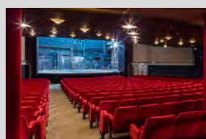
N° 7 - La salle (orchestre), mars 2013 - 33 x 48 cm, tirage pigmentaire sur papier baryté