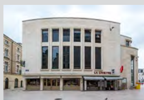
N° 3 - Façade rue Gambetta, mai 2013 - 33 x 48 cm, tirage pigmentaire sur papier baryté