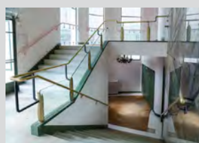
N° 6 - Le grand hall, escalier principal, mars 2013 - 33 x 48 cm, tirage pigmentaire sur papier baryté