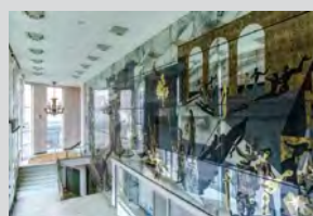
N° 5 - Le grand hall, mars 2013 - 33 x 48 cm, tirage pigmentaire sur papier baryté