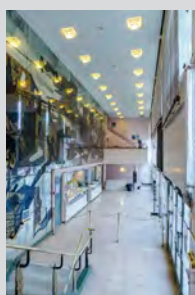
N° 4 - Le grand hall, décembre 2012 - 33 x 48 cm, tirage pigmentaire sur papier baryté